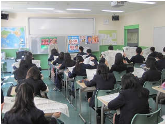
上左：投票前、授業で模擬選挙の説明と選挙公報を実際に読み比べる

玉川学園中学・高等学校（東京都町田市）では、模擬選挙を学校の授業などで取り入れ、未成年世代の政治意識向上に取り組んでいる。今回も、未成年“模擬”東京都知事選を 4 月 4 日から 6 日にかけて中央委員会と社会地歴公民科が呼びかけで行った。