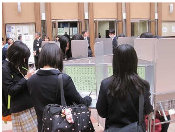
下左：町田市選挙管理委員会より、実際の選挙で使用する投票箱や記載台などを借り受けた 下右：選挙推進キャラクター「めいすいくん」も駆けつけた